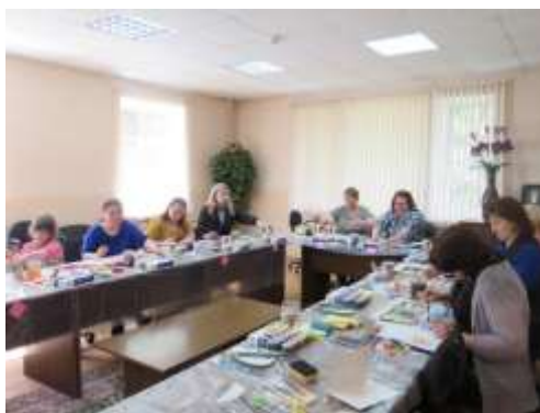
Рисунок 3. Арт-терапия. Родитель-волонтер обучает специалистов, родителей, детей

Инновации: Родители, воспитывающие детей-инвалидов, детей с ограниченными возможностями здоровья, изготавливают из природного материала музыкальный инструмент и используют его в домашних условиях на практике для снятия эмоционального напряжения и решения психологических проблем.