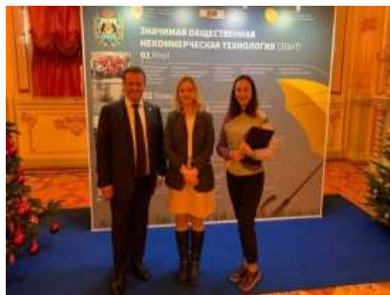
Рисунок 12. Государственный совет по социальной политике Российской Федерации