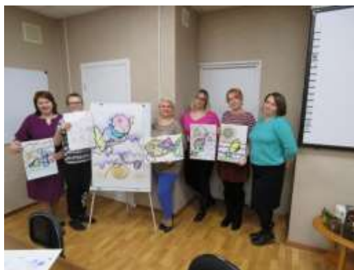
Рисунок 5. Нейрографика - волонтеры, родители, ребенок-инвалид, специалисты