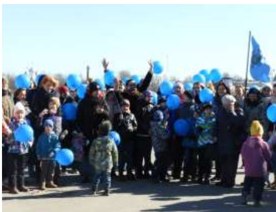
Рисунок 11. Акция "Зажги синим"

Практика вошла во Всероссийский сборник франшиз от АВИЦ (ассоциация волонтерских центров). (Рисунки 12-14)