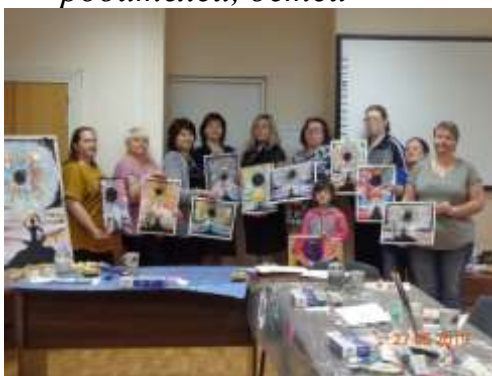
Рисунок 4. Арт-терапия. Работа с чувством страха – волонтеры, родители, дети, специалисты