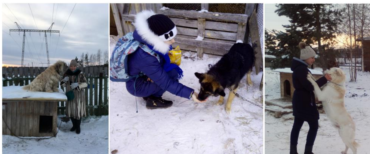
Рис. 2. Студенты и преподаватели в гостях у пушистых друзей