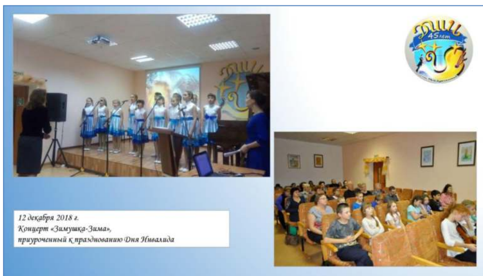
12 декабря 2018 г. Концерт «Зимушка-Зима», приуроченный к празднованию Дня Инвалида