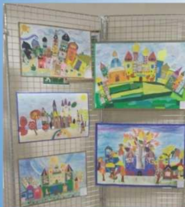
Выставка «Моя Родина - Сибирь»