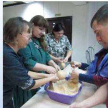
30 ноября, 1 декабря 2019 г. Мастер-класс «Шпаячиқъ своими руками» для представителей Клуба людей с ОВЗ «Зодиак» Филиал Детской школы искусств в пгт. Мортка